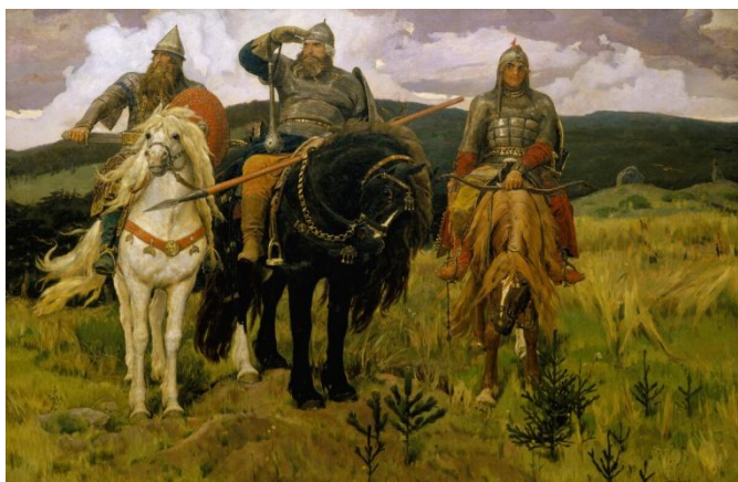
В.М. Васнецов «Богатыри»

- Посмотрите на эти 4 фотографии и скажите, что их объединяет: